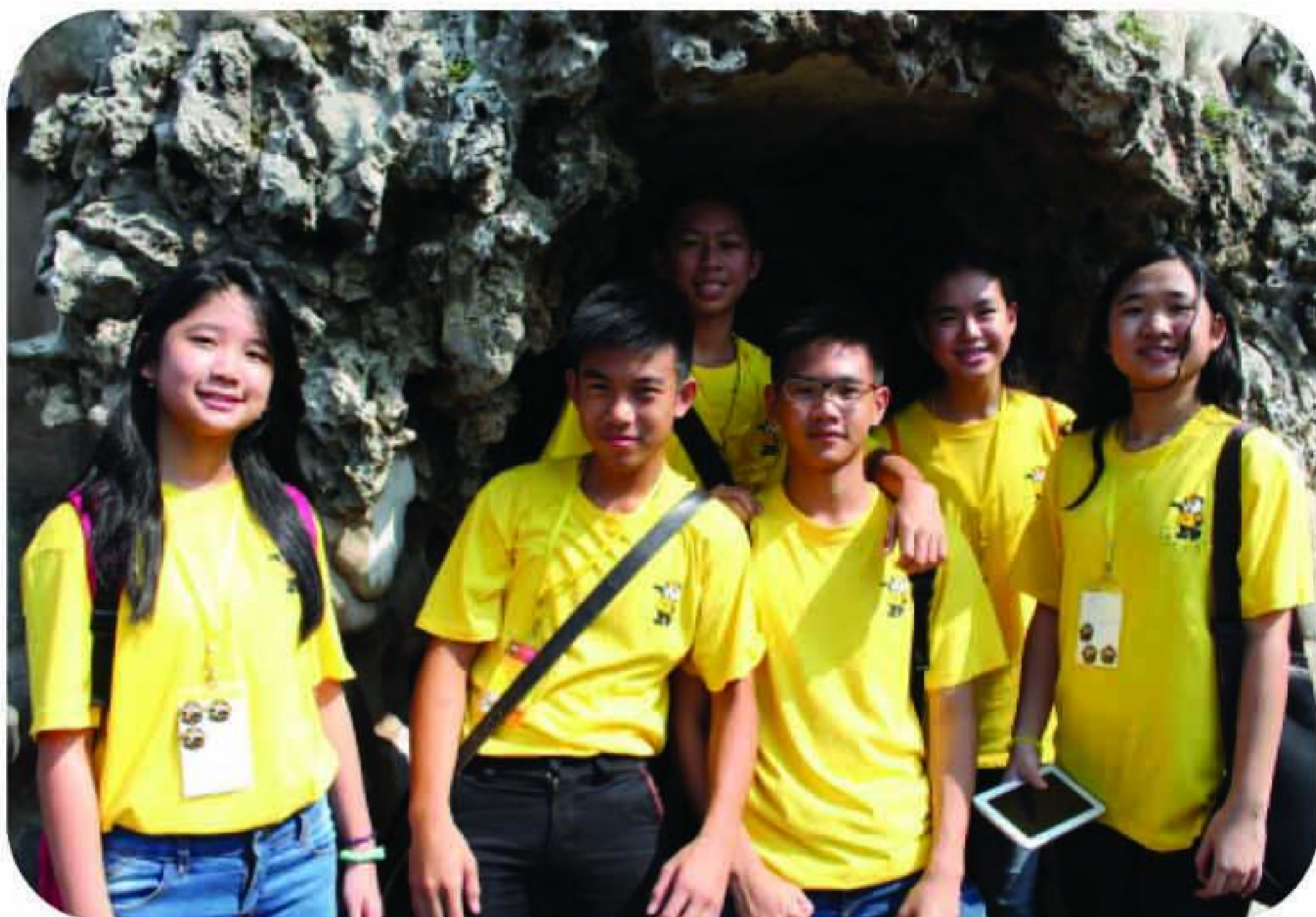
Wisata ke Goa Sunyaragi