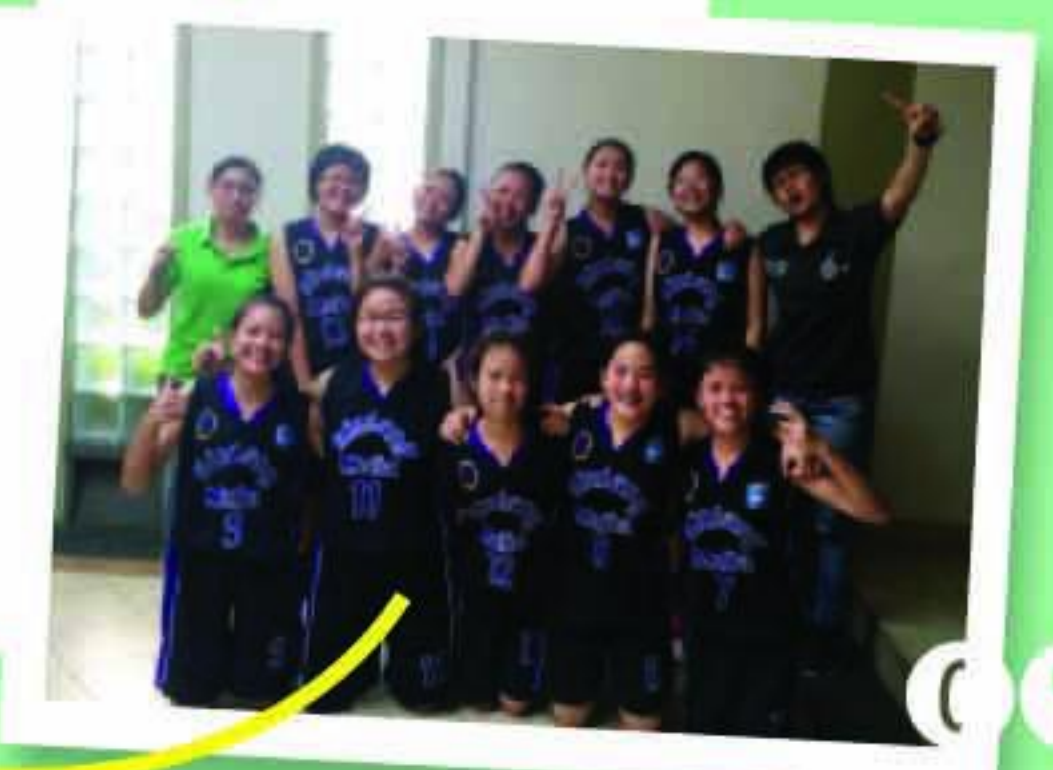
SMP BM-Juara 1 Singgasana Cup III