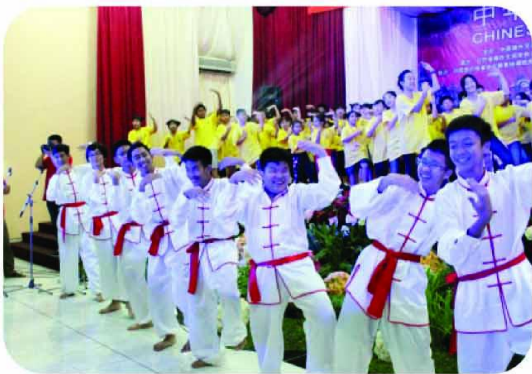
Tarian Little Apple

Para peserta sangat menikmati kegiatan ini, dimana selama 10 hari mereka belajar berbagai macam ketrampilan, seperti kaligrafi, seni lukis, alat musik hu lu si, seni menggunting dan tali temali. Guru-guru yang mengajar adalah guru profesional, terbukti dari hasil karya siswa dan pertunjukan di akhir acara yang mendapat sambutan yang meriah.