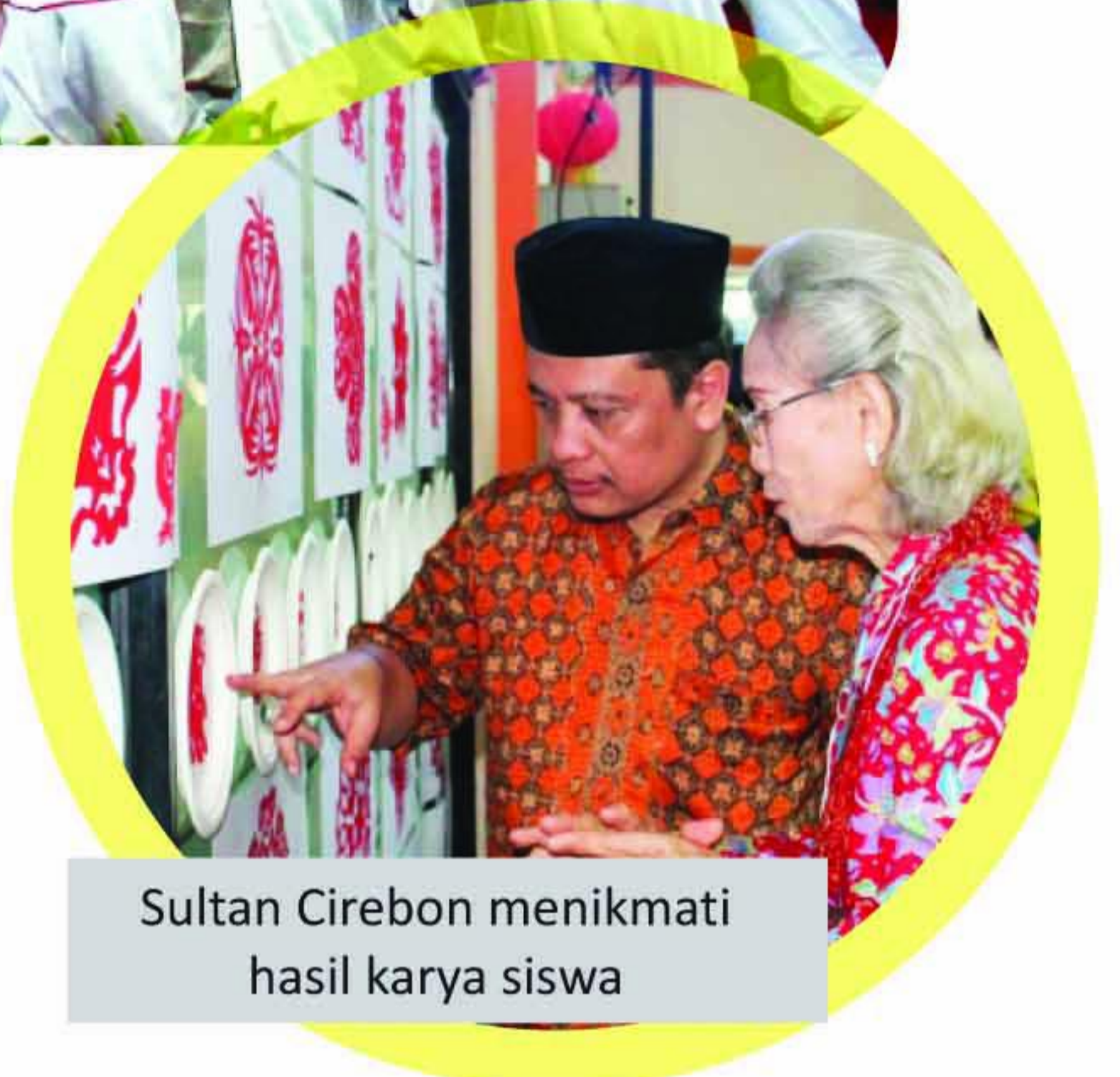
Sultan Cirebon menikmati hasil karya siswa

Pada liburan kenaikan kelas yang lalu, tanggal 22 Juni sampai dengan 1 Juli 2015, diadakan kegiatan Chinese Culture Camp di Kota Cirebon. Kegiatan ini diikuti oleh sedikitnya 140 orang siswa sekolah dari Jawa Barat dan Jakarta. 12 orang guru khusus didatangkan dari Provinsi Liaoning, China untuk mengajarkan berbagai macam pengetahuan tentang bahasa, sejarah, dan seni kebudayaan China.