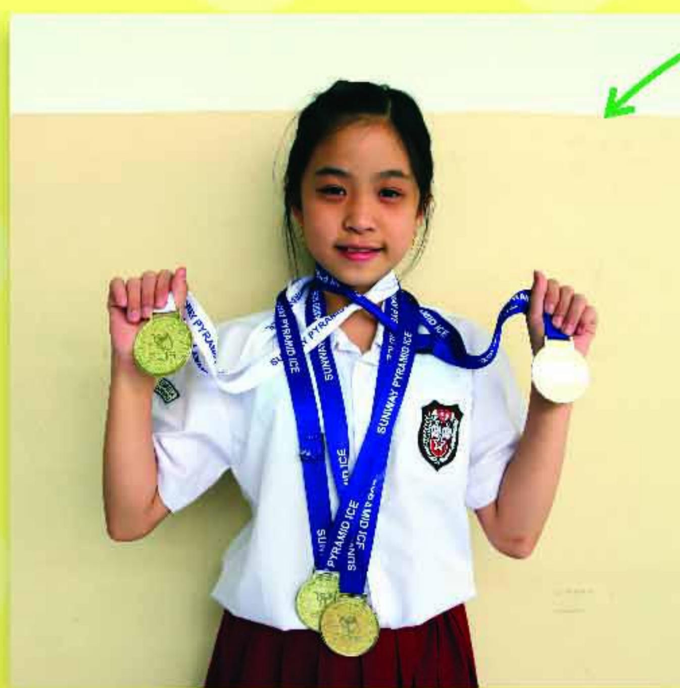
Juara Kategori Foot Work, Artistik, Ribbon ISI Asia 2016 (SDK HITS)