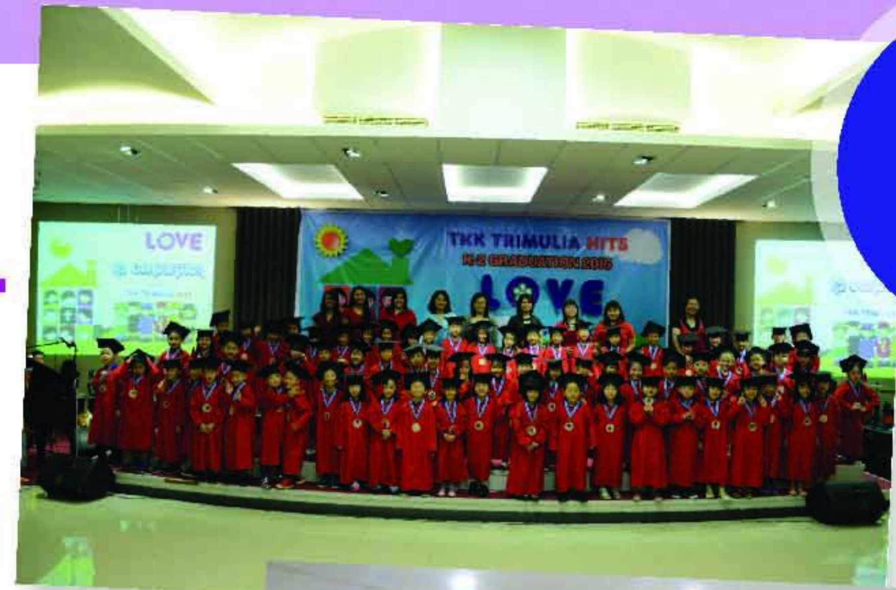
TKK Trimulia HITS

Lalu pada tanggal 10 Juni 2016, anak – anak Kindergarten 2 memakai toga dan secara resmi sudah menyelesaikan masa sekolahnya di TKK Trimulia HITS. Sudah tiba saatnya untuk berpisah dan melanjutkan ke jenjang Sekolah Dasar. Good Luck, Children and God Bless You. (KEA)