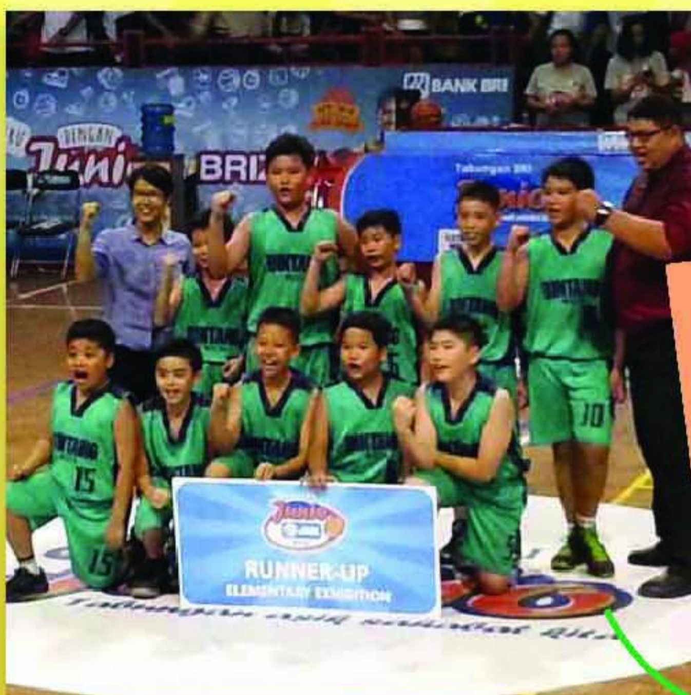
Runner Up JRBL 2015 (SD BM)