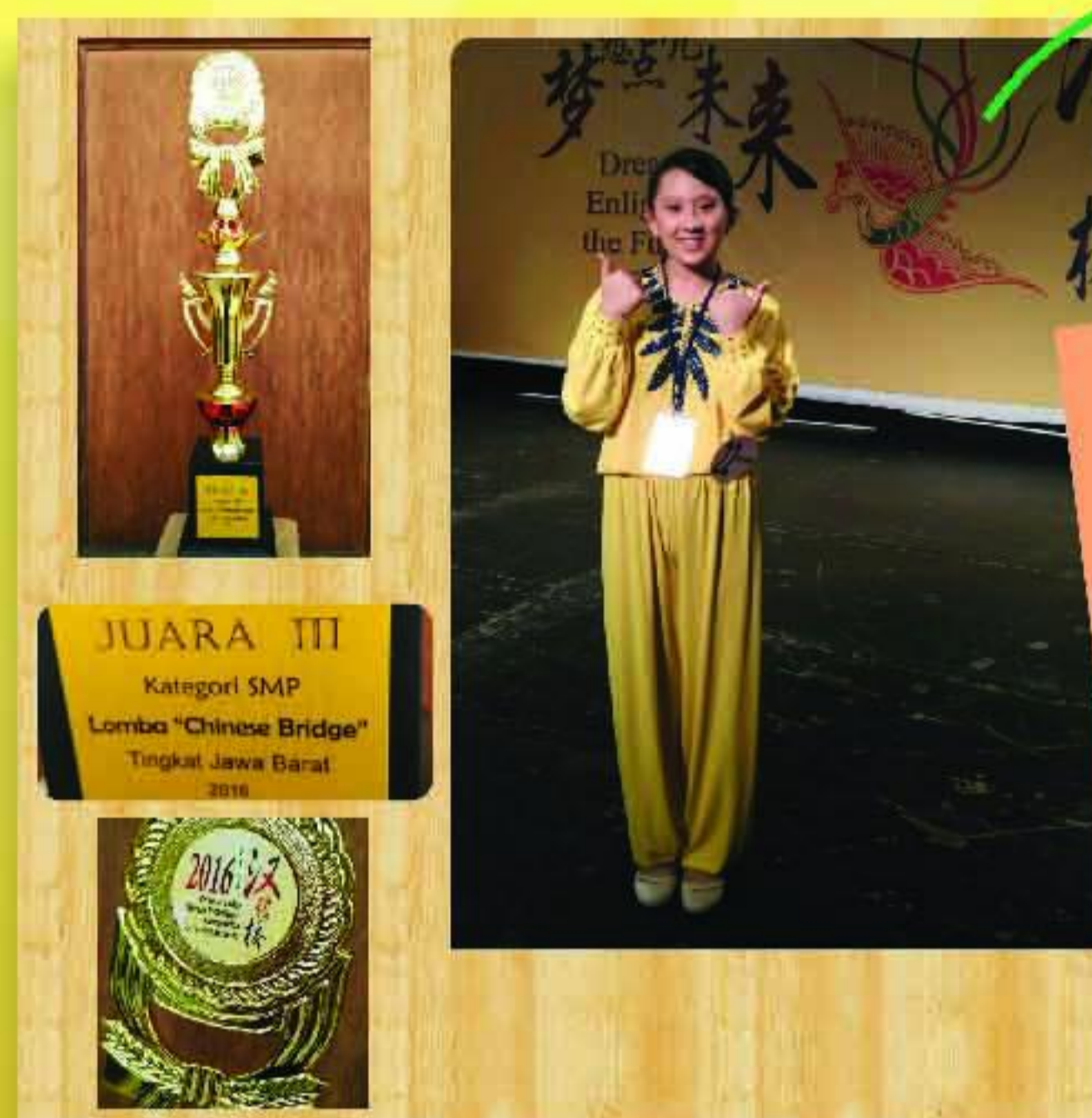
Juara 3 Chinese Bridge Competition Tingkat Jawa Barat 2016 (SMP BM)