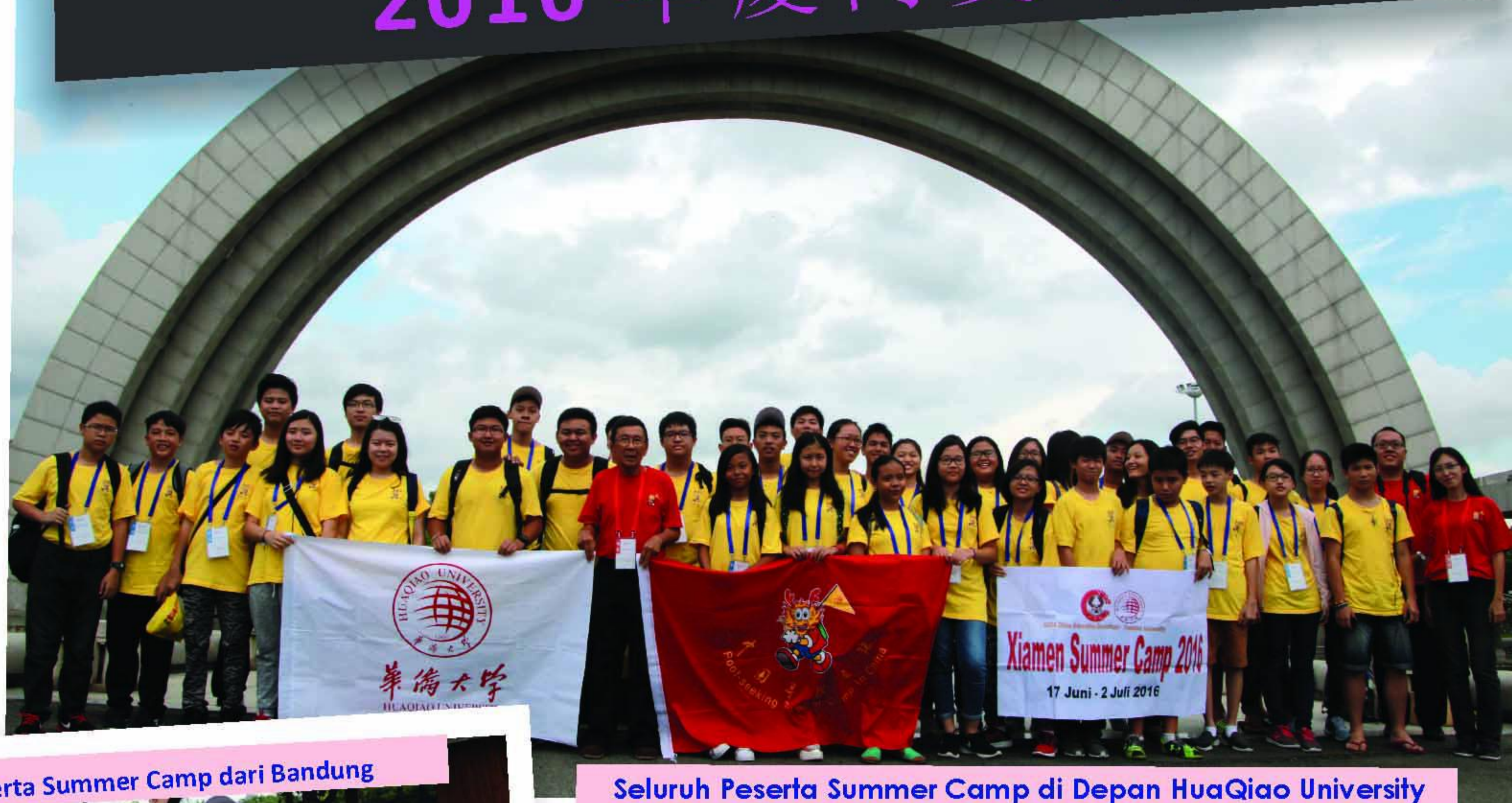
Peserta Summer Camp dari Bandung