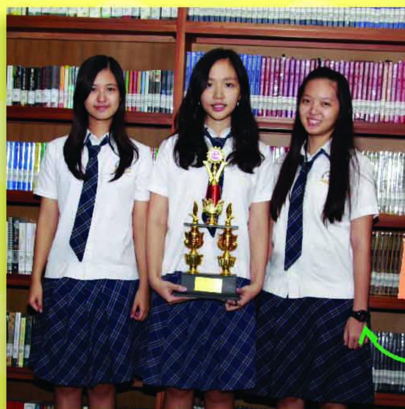
Juara 1 Omentum Kedokteran UKM 2016 (SMA BM)