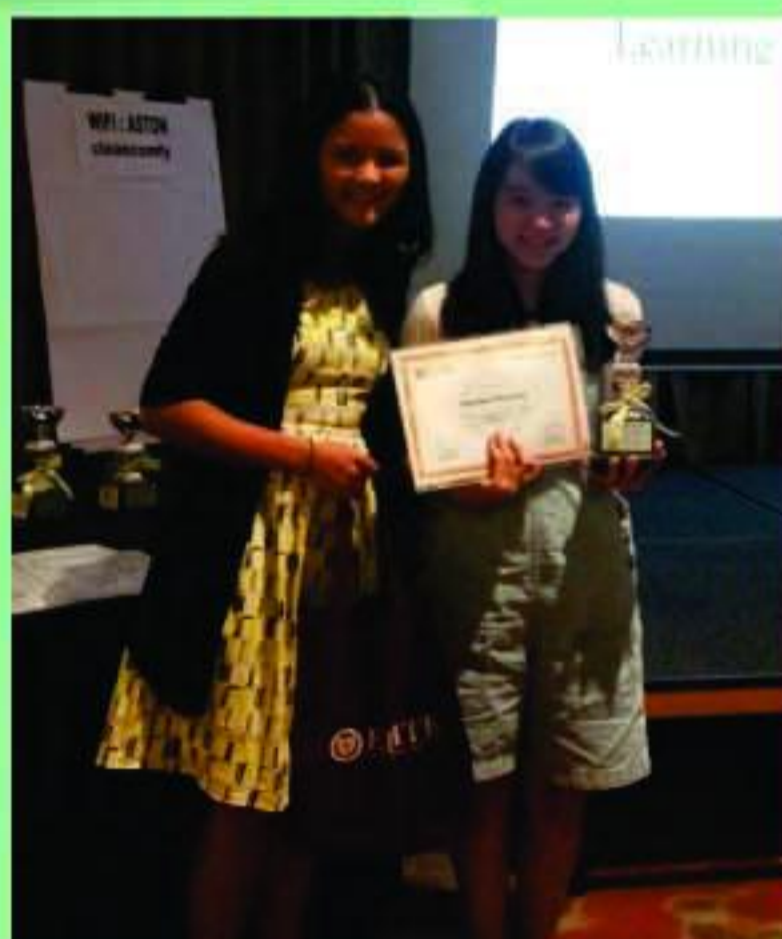
SMP BM - Elite Speech Tournament