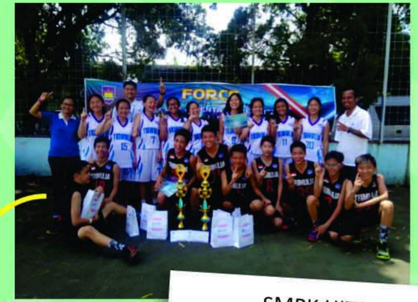
SMPK HITS - SMAK 3 BPK Penabur Cup 2017