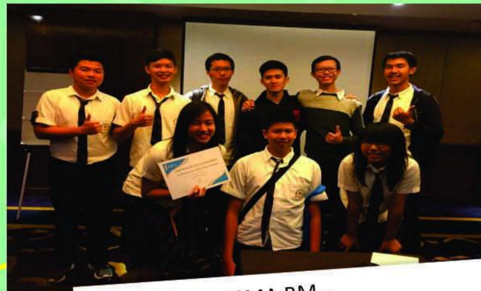
SMA BM - I3L Science Idea Competition 2017