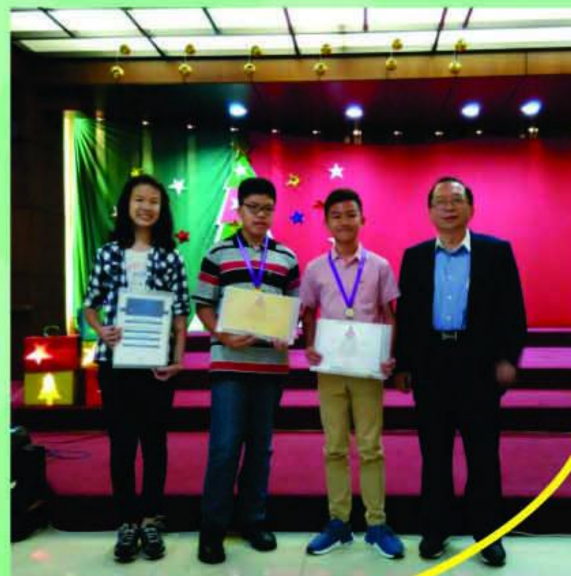
SMP BM - American Mathematic Olympiad - CAT 2016