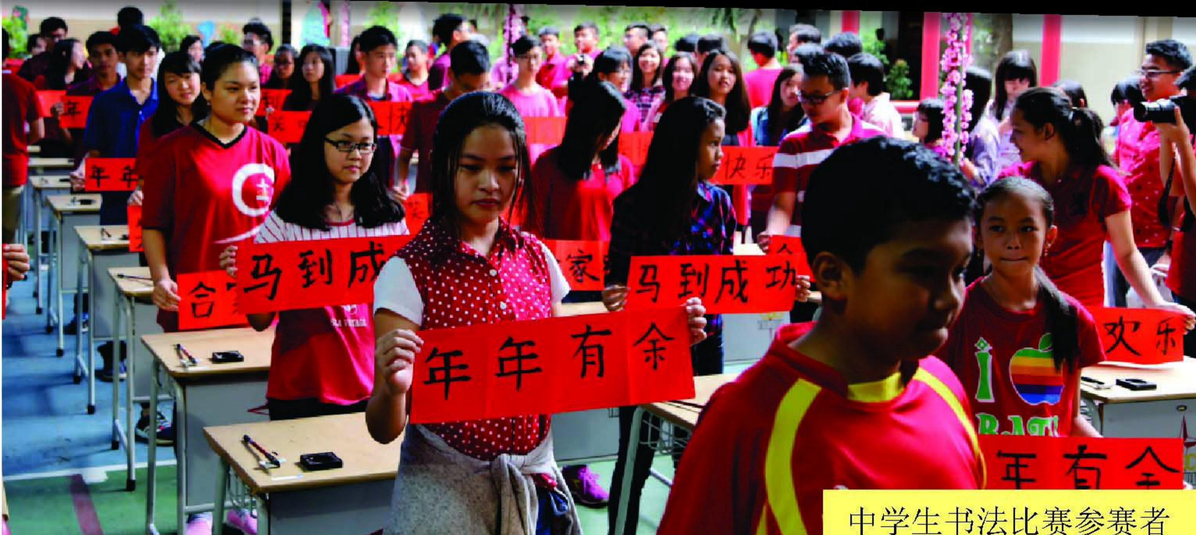
中学生书法比赛参赛者 Finalis Lomba Kaligrafi Tingkat SMP dan SMA

2017年2月3号在万隆三一学校的操场上，一年一度的中华文化春节晚会随着一阵激情高昂的鼓乐拉开了序幕。接着，学生和老师用喜庆、欢快的歌声恭贺新年的到来