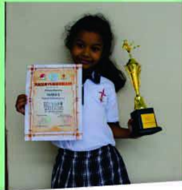
SDK HITS - Eco Bambu Wushu Festival Bandung Raya