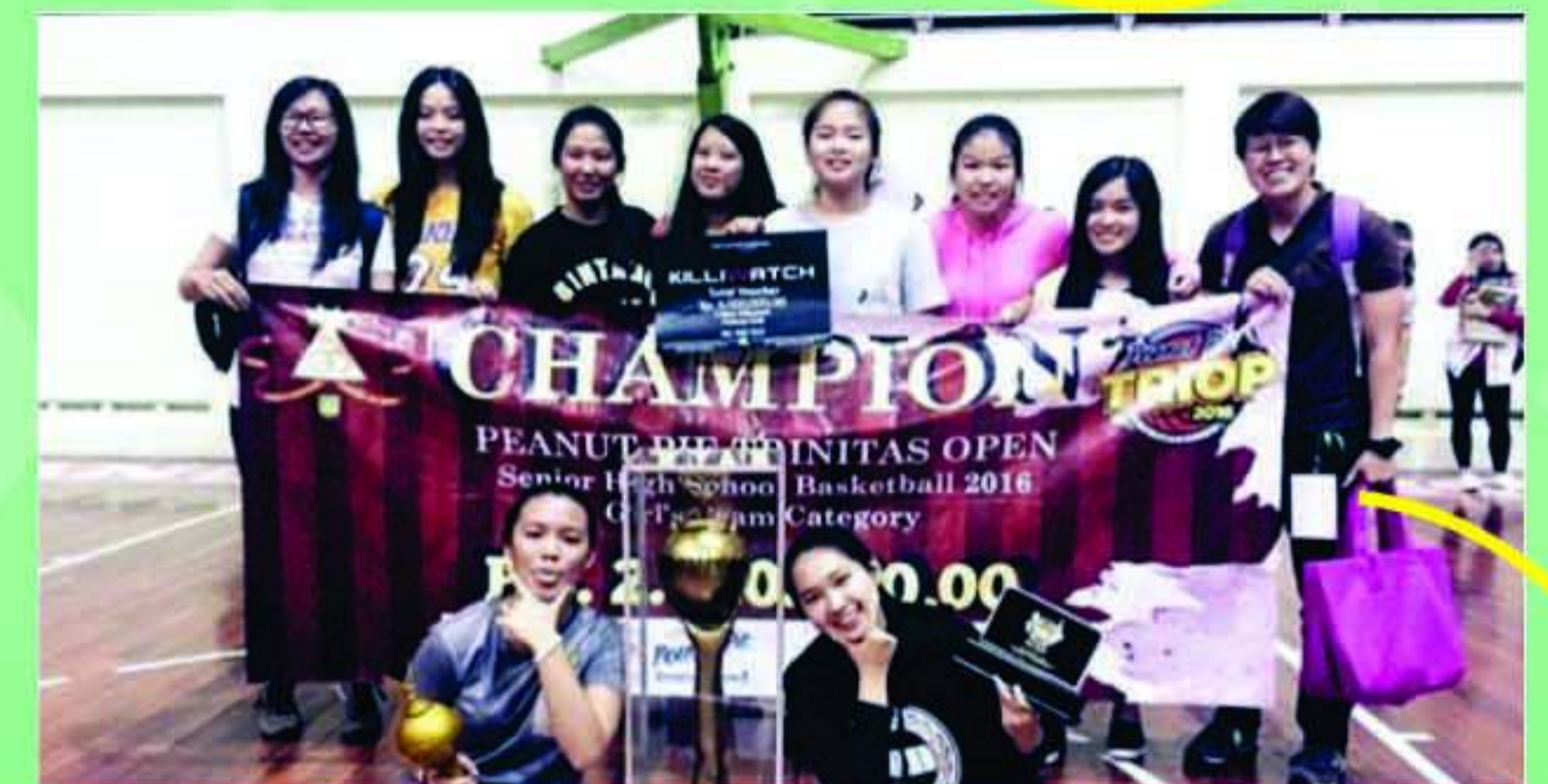
Tim Basket Putri SMA BM: Triop 2016