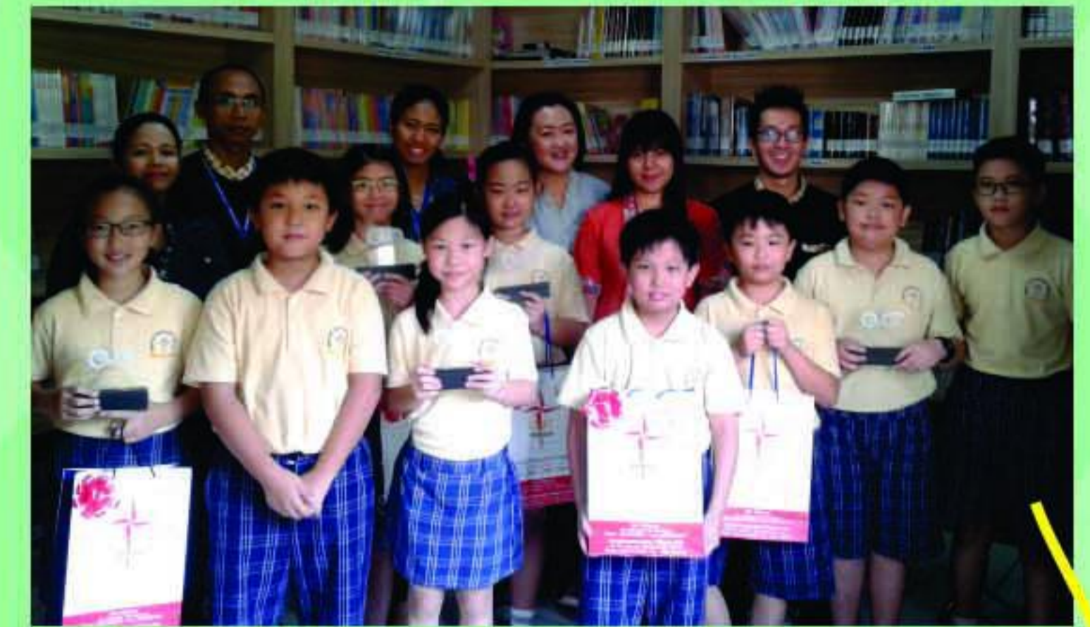
SD BM - TEFCON 2017