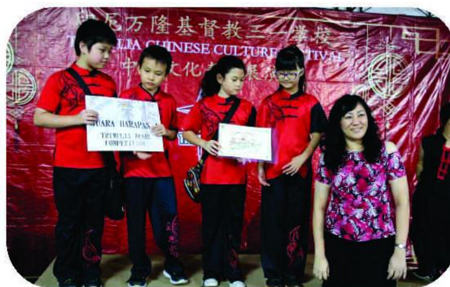
三一学校的小学生参加武术比赛并得奖

Trimulia All Stars gabungan guru dan siswa membuka acara TM CCF