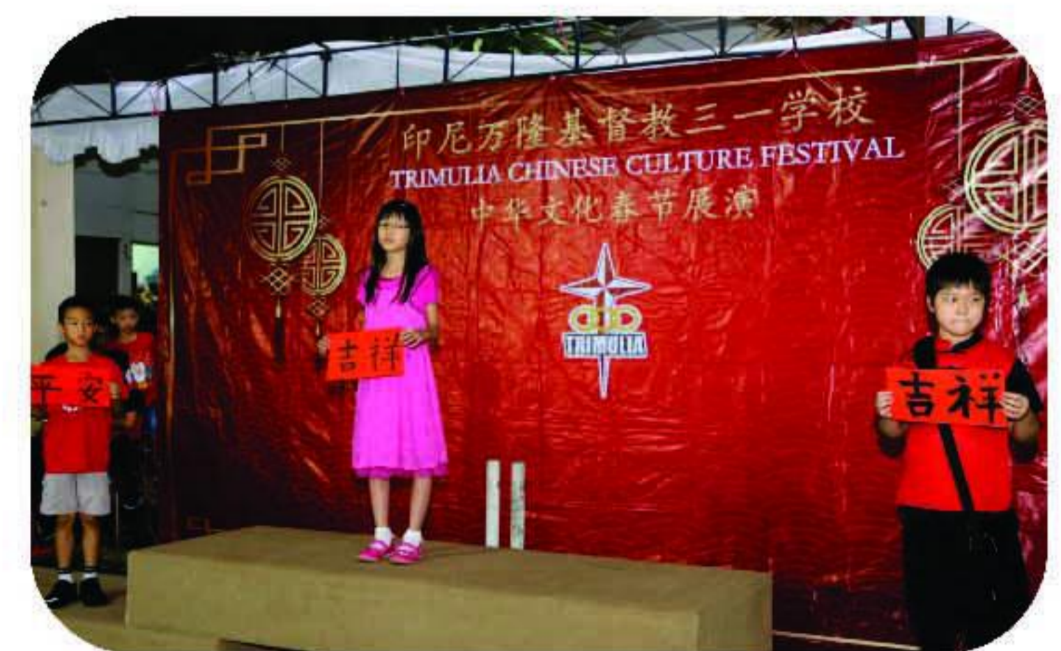
小学生书法比赛冠军

Siswa SD Trimulia Peserta Lomba Wushu meraih juara Harapan 1