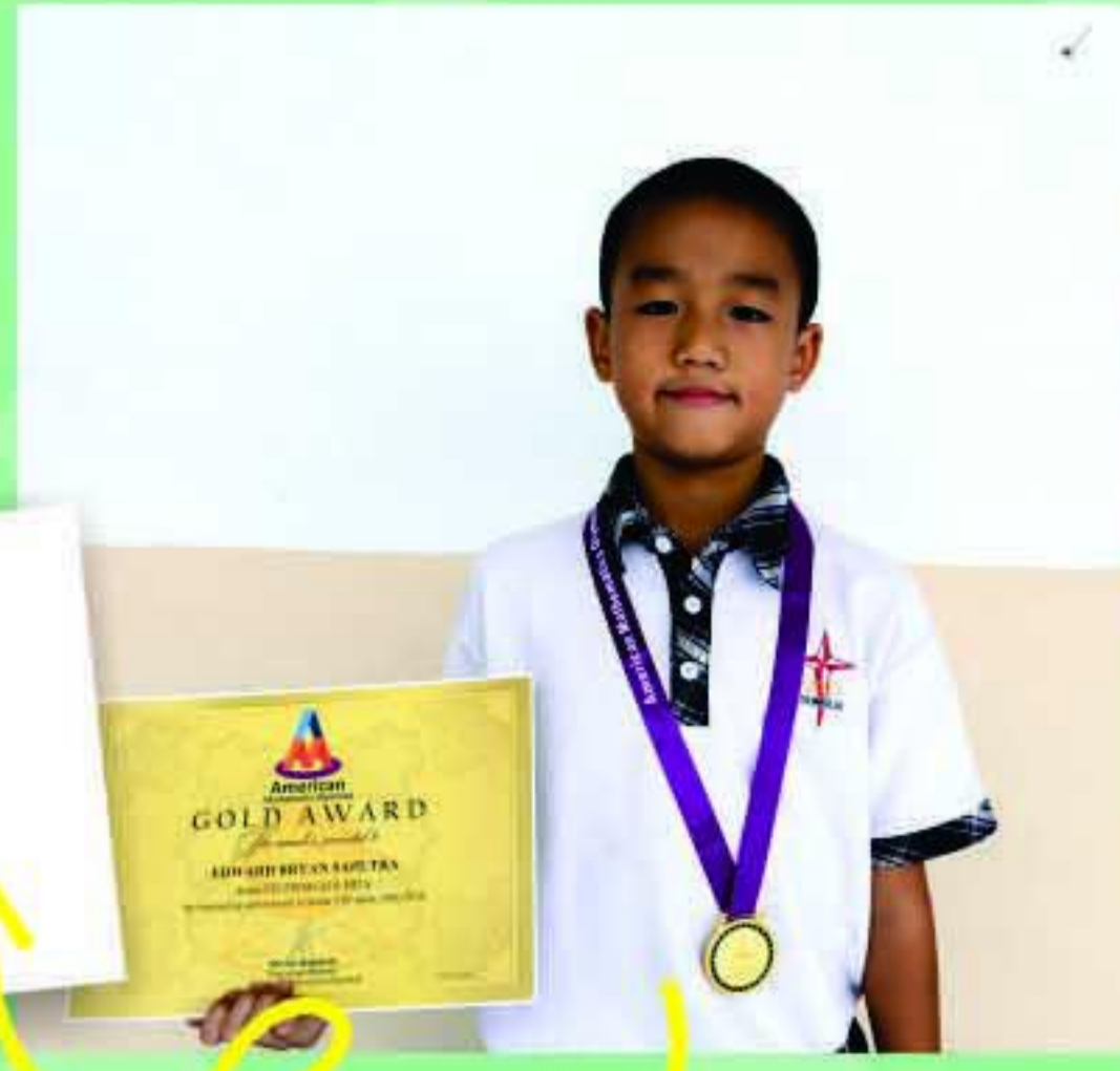
SDK HITS- American Mathematics Olympiad 2016