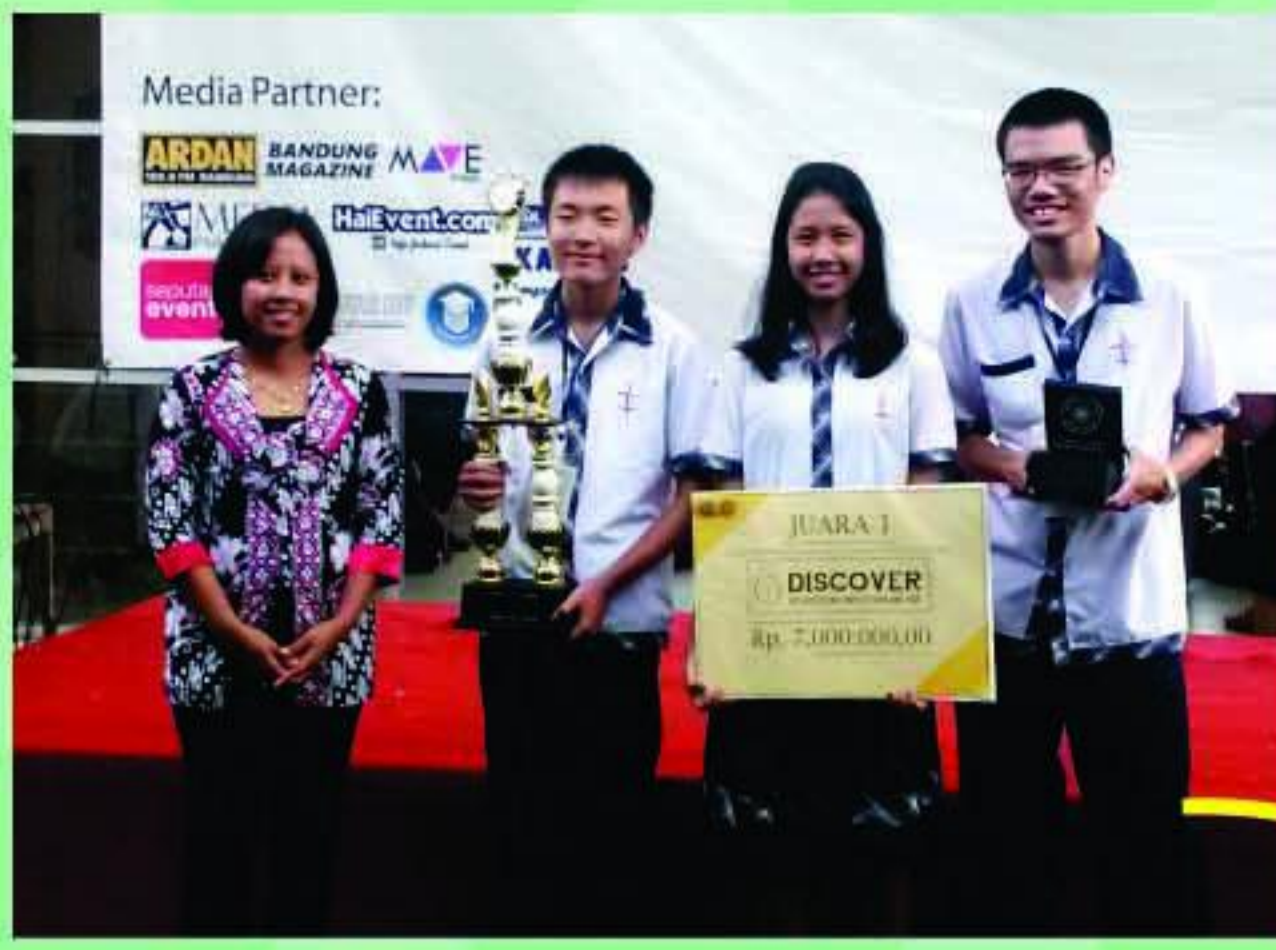
SMAK HITS - Discover 2017